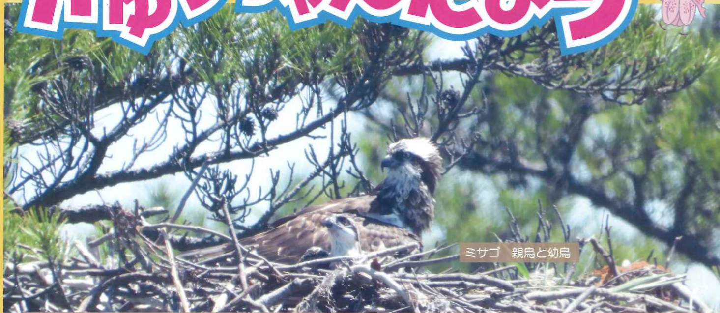
ミサゴ 親鳥と幼鳥

豊かな自然が残っている九十九島周辺では、豊富な餌場と身を隠す隠れ場に恵まれ、多くの野鳥が生息しています。春から夏にかけて鳥たちの子育てが始まり、九十九島周辺ではミサゴの子育ての様子を遊覧船から観察できます。また、九十九島パールシーリゾート内にあるうみかぜ広場では、親鳥たちが子育てのために懸命にエサとなる昆虫を捕まえる姿を見ることができます。今回は九十九島周辺で見られる幼鳥の様子をご紹介します。