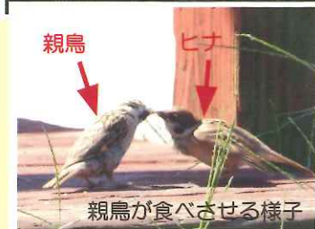
親鳥が食べさせる様子