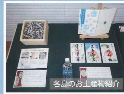
各島のお土産物紹介