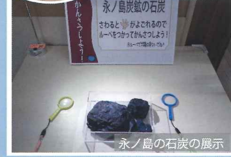
永ノ島の石炭の展示