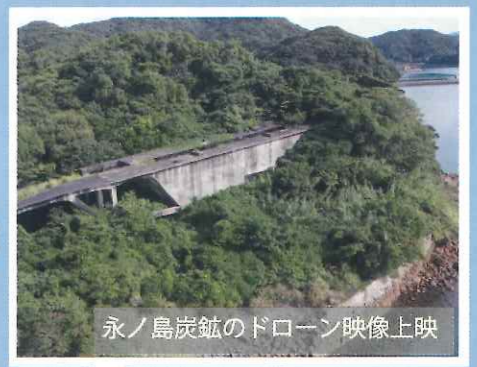
永ノ島炭鉱のドローン映像上映