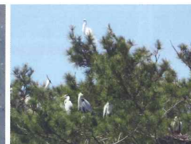
サギ類のコロニー