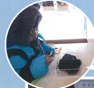
ルーペで観察 してみてくださいね(^ ^)