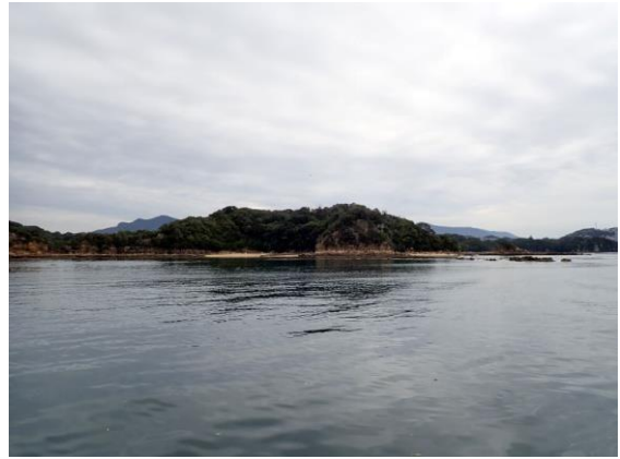
鳥ノ巣島 (9 : 58)