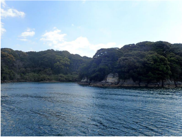
元ノ島 (10 : 07)