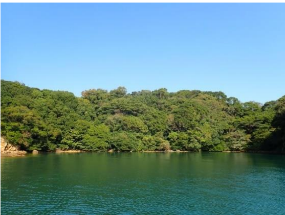
牧島 (11 : 02)