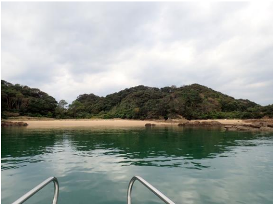
金重島 (10 : 22)