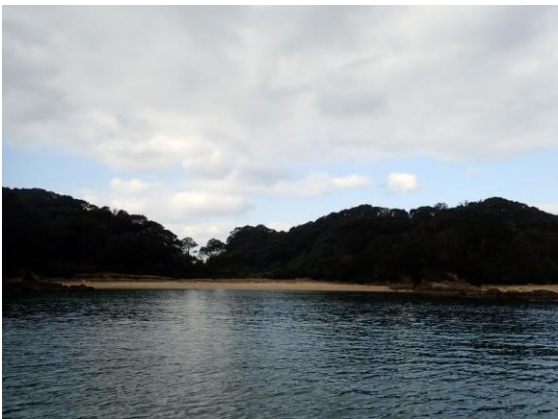
金重島 (10 : 32)