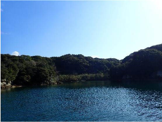
元ノ島 (10 : 00)