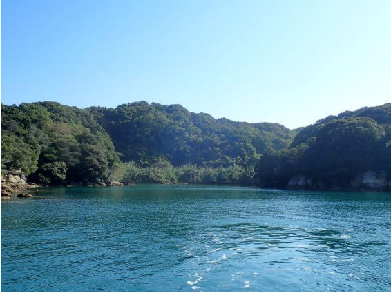
元ノ島 (9 : 59)