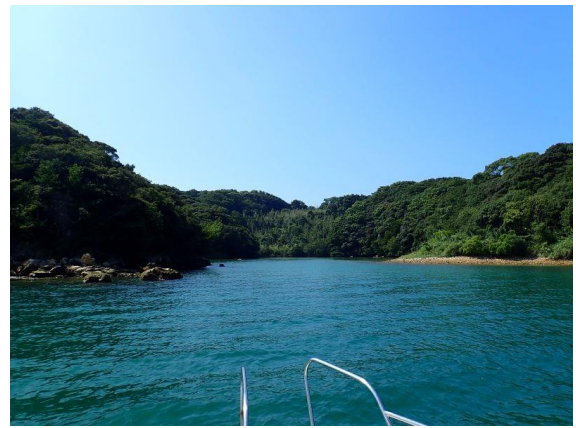
七郎鼻 (11 : 05)