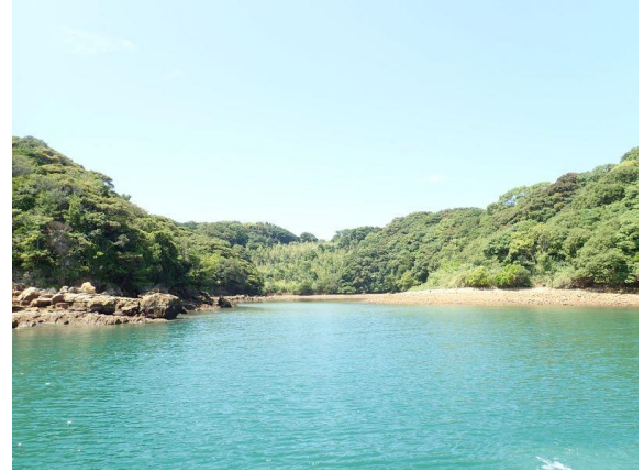
七郎鼻 (11 : 00)