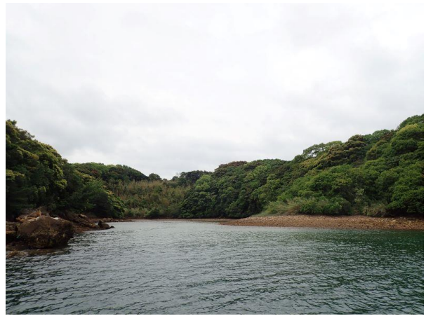
七郎鼻 (10 : 52)