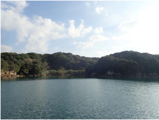
元ノ島(9 : 55)