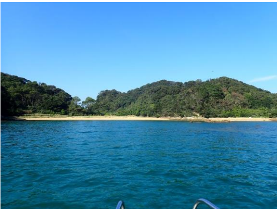
金重島 (10 : 17)