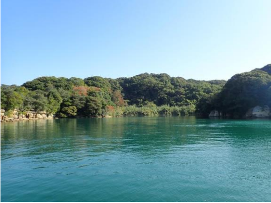
元ノ島(10 : 15)