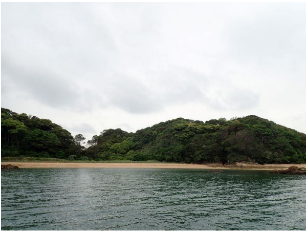
金重島 (10 : 27)