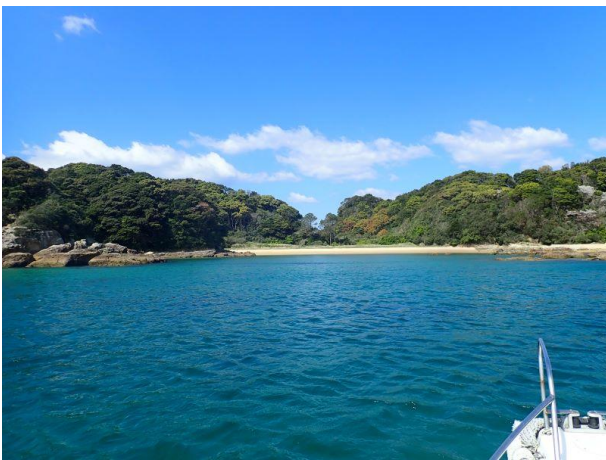
金重島 (10 : 31)