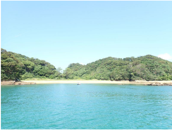
金重島 (10 : 26)