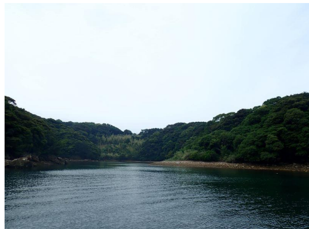
七郎鼻 (10 : 51)