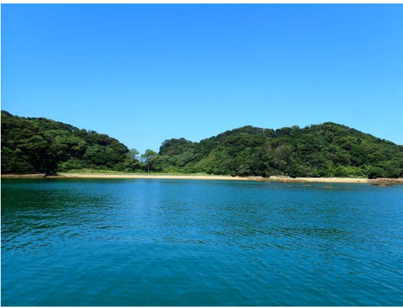
金重島 (10 : 35)