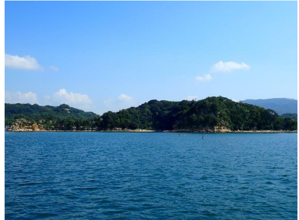
鳥ノ巣島 (10 : 23)