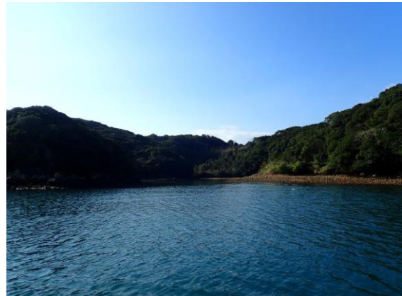
七郎鼻(10 : 44)