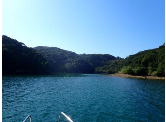
七郎鼻 (10 : 30)