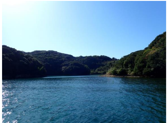
七郎鼻(11 : 17)