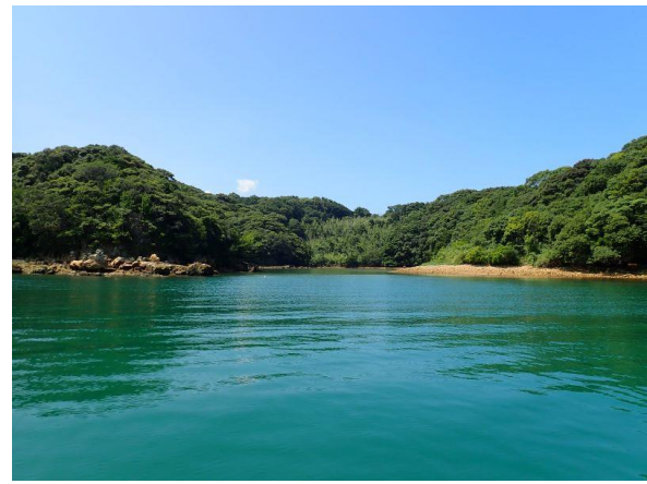
七郎鼻 (11 : 16)