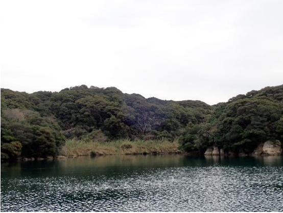
元ノ島 (9 : 54)