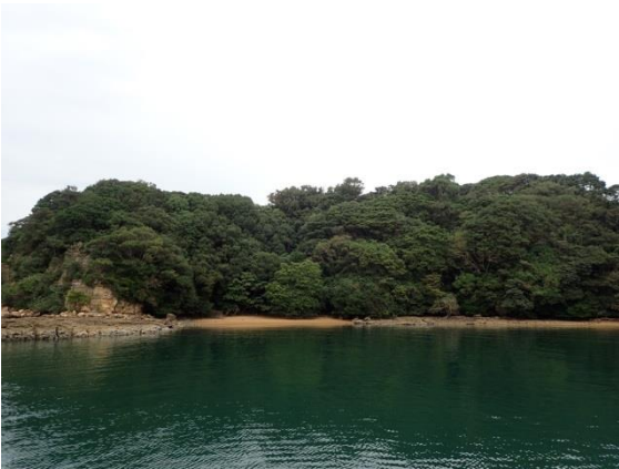
牧島 (11 : 30)