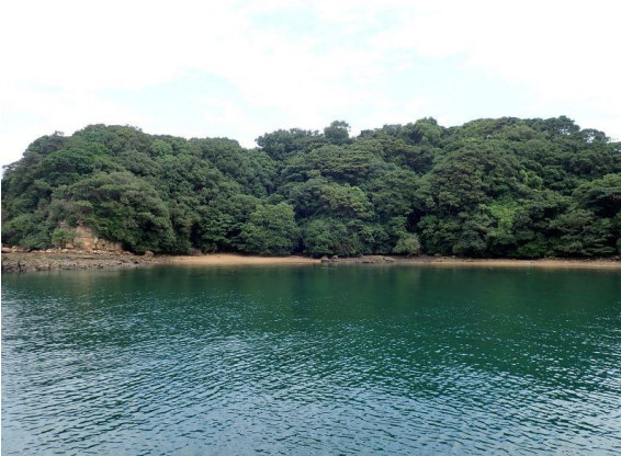
牧島 (11 : 41)

曇り／晴れ 南西 2m/s、波なし 27日～28日に降った豪雨の影響か、透明度悪くゴミや流木が多かった。