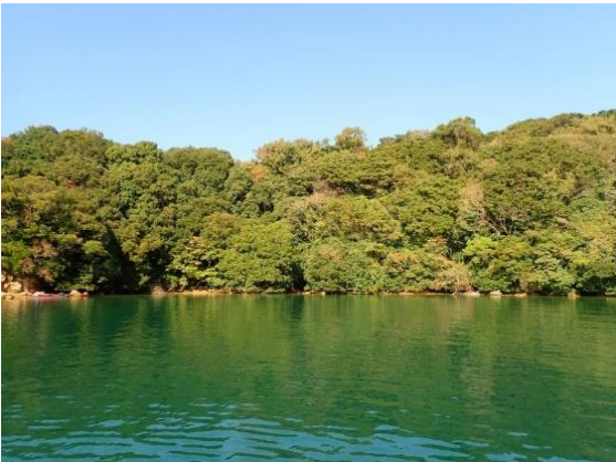
牧島(11 : 54)