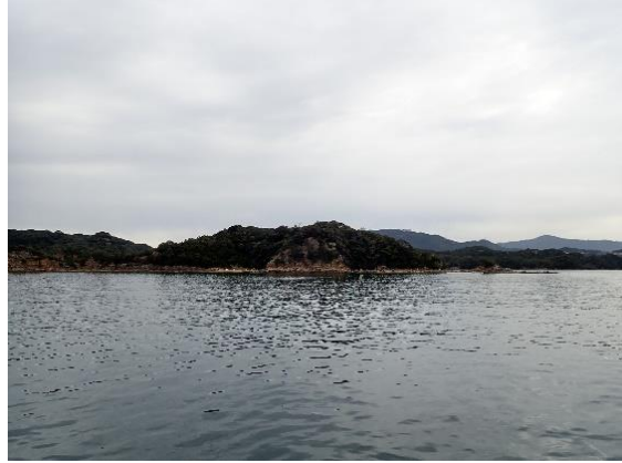
鳥ノ巣島 (9 : 58)