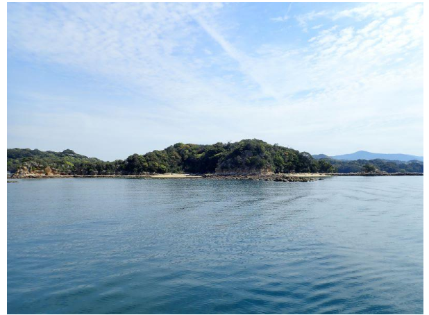
鳥ノ巣島 (10 : 18)