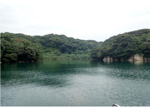
元ノ島 (10 : 06)