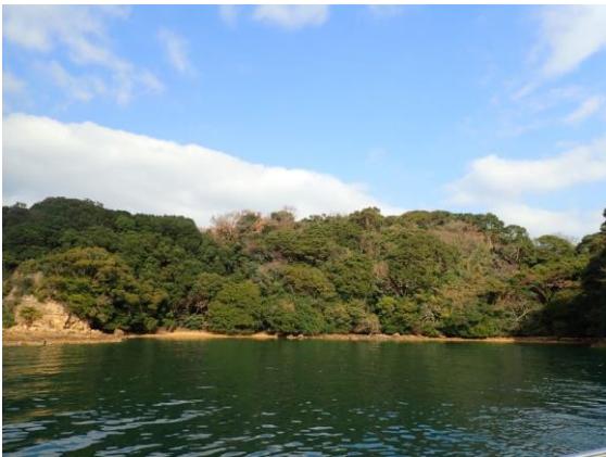
牧島 (11 : 18)