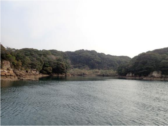
元ノ島 (10 : 12)