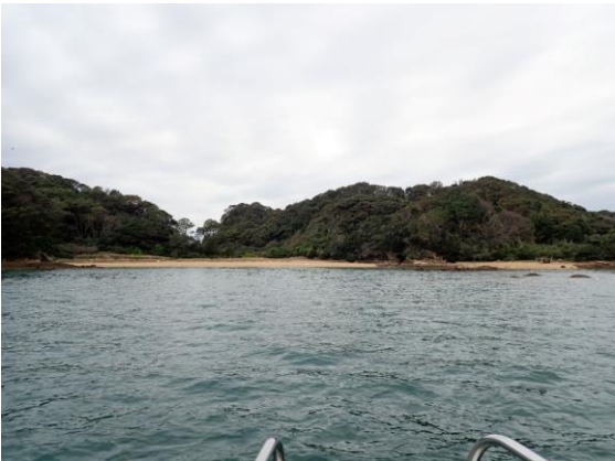
金重島 (10 : 09)