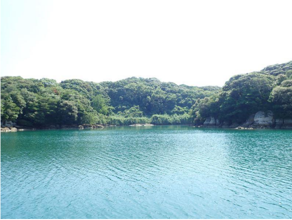
元ノ島 (10 : 05)