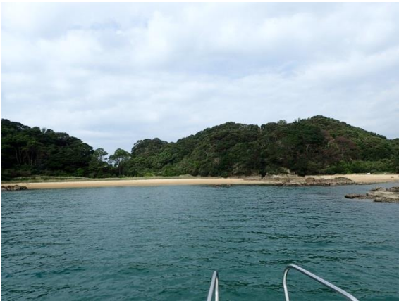
金重島 (10 : 42)