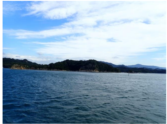
鳥ノ巣島 (10 : 02)