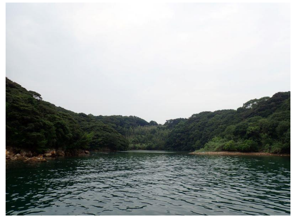
七郎鼻 (10 : 52)