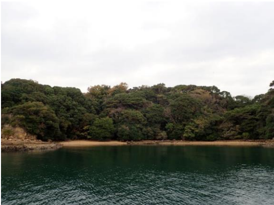
牧島 (11 : 04)