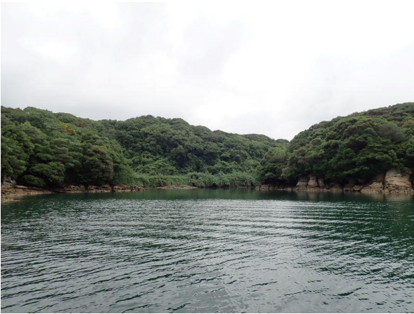
元ノ島 (10 : 16)