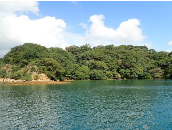
牧島 (10 : 55)