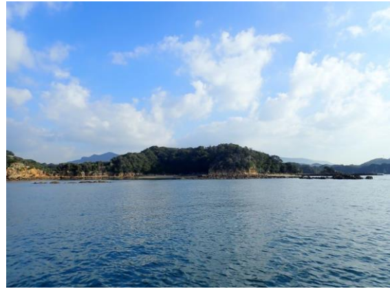
鳥ノ巣島(10 : 02)