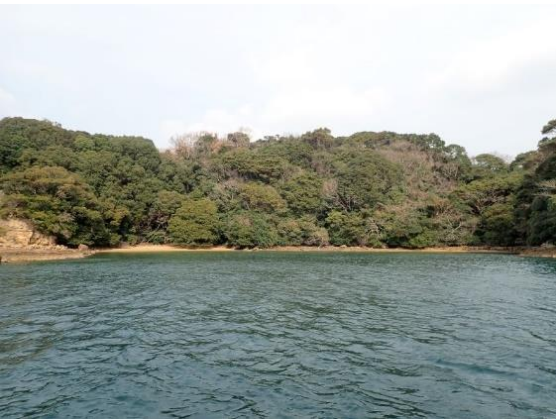
牧島 (11 : 48)