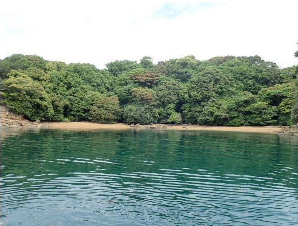
牧島 (11 : 11)