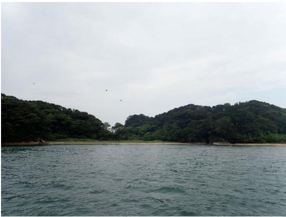
金重島 (10 : 29)