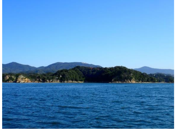
鳥ノ巣島(10 : 36)