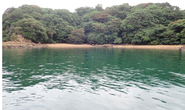
牧島 (11 : 39)

曇り/雨 南南東 3m/s、波 1m うねりあり。多数の流れ藻確認。金重島でハマオモト開花確認。少し透明度が悪い。