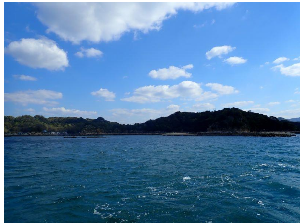
鳥ノ巣島 (10 : 14)