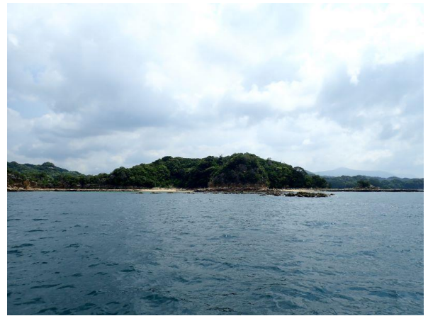
鳥ノ巣島 (10 : 21)