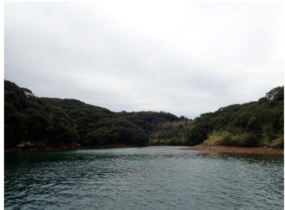
七郎鼻 (10 : 35)