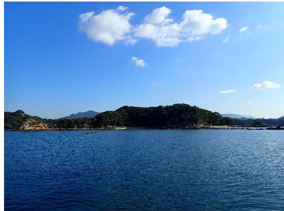
鳥ノ巣島 (10 : 07)