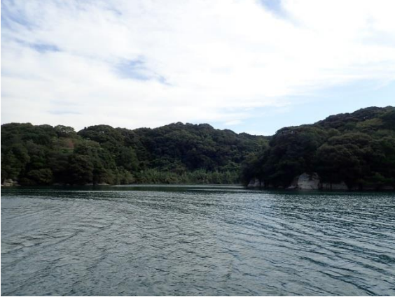
元ノ島 (9 : 55)