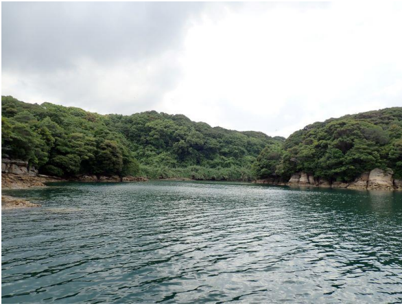
元ノ島 (10 : 14)