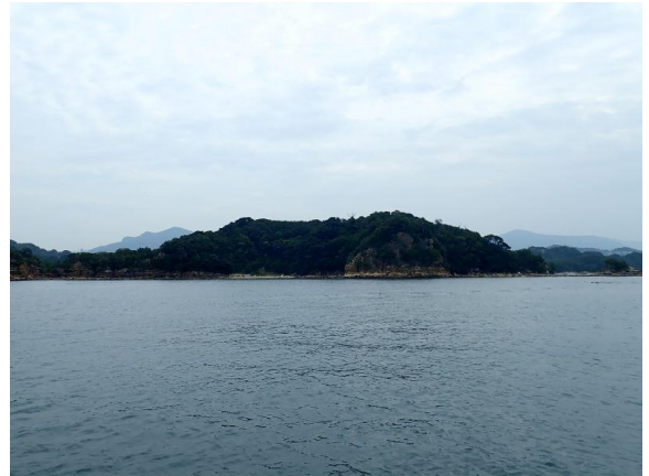
鳥ノ巣島 (10 : 13)