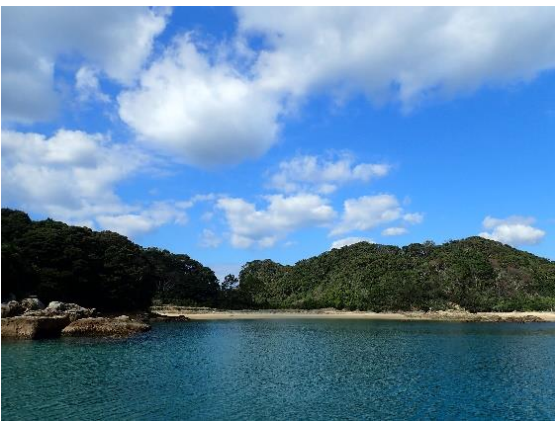
金重島 (10 : 49)