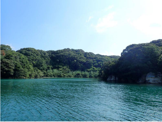
元ノ島 (10 : 15)