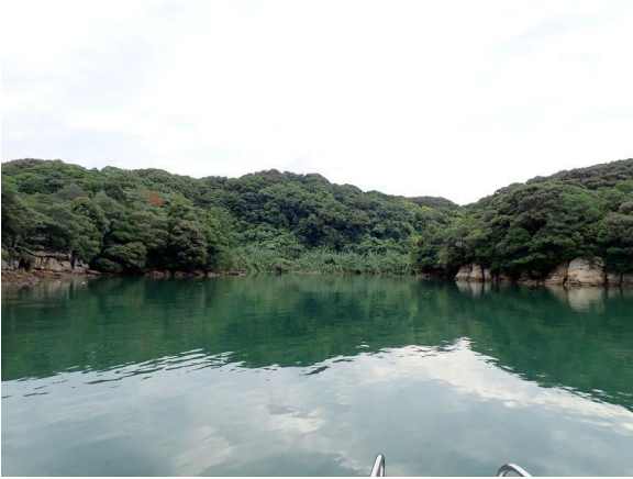
元ノ島 (10 : 04)