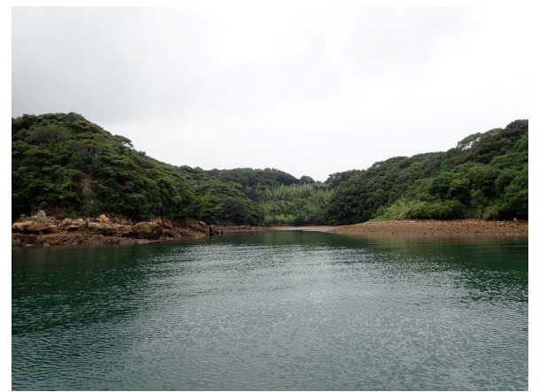
七郎鼻 (11 : 12)