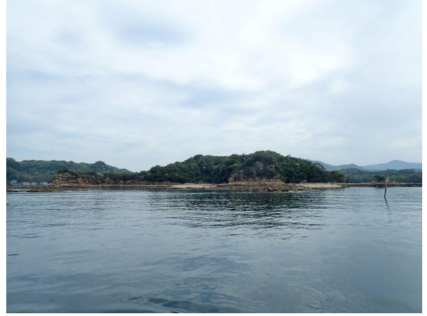
鳥ノ巣島 (10 : 11)