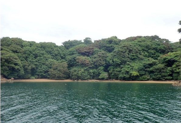
牧島 (11 : 09)

曇り 南西 2m/s、波 1m 波、風弱く穏やかだった。長南風の巣でミサゴ 4羽確認。すぐ近くの岩に 1羽確認。