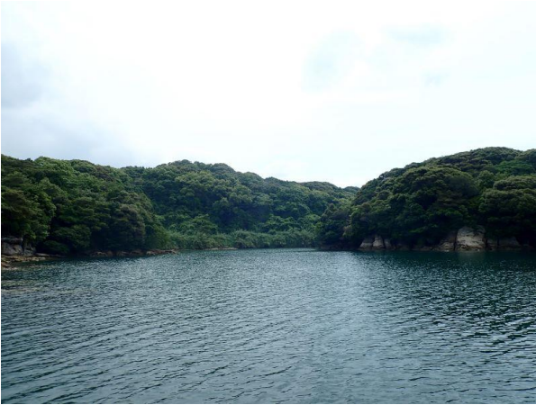
元ノ島 (10 : 08)