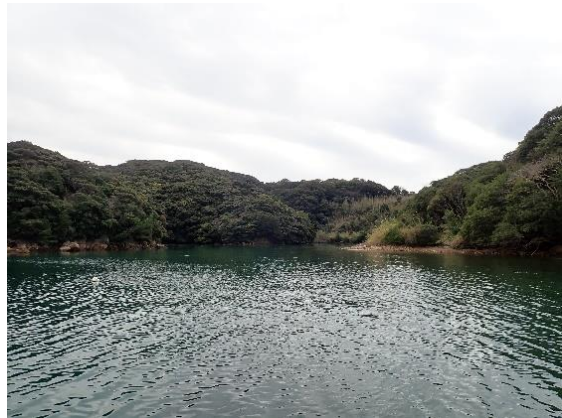
七郎鼻 (10 : 32)