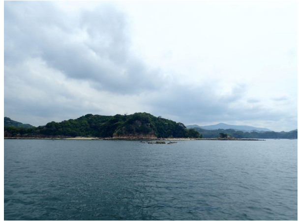
鳥ノ巣島 (10 : 13)