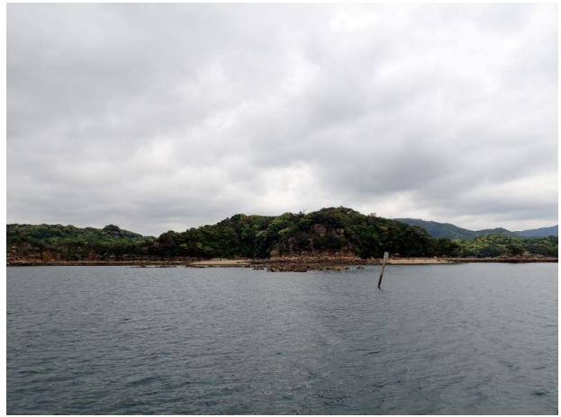
鳥ノ巣島 (10 : 08)