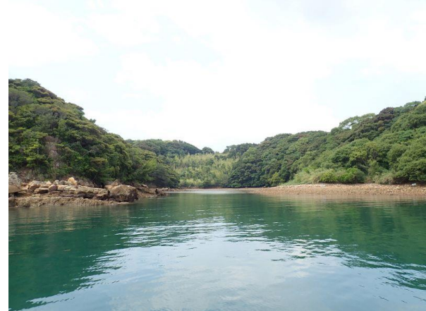
七郎鼻 (11 : 10)