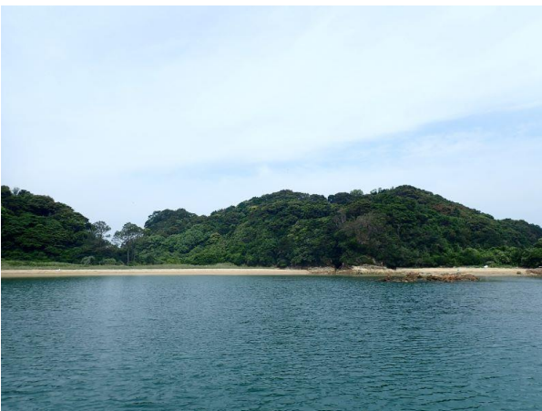
金重島 (10 : 28)