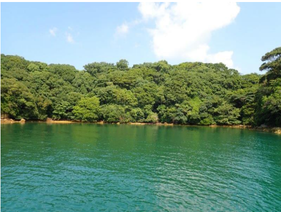
牧島 (11 : 30)

曇り／晴れ 北 2m/s、波 1m 多くの島に釣り人上陸していた。前回計測と同様、塩分濃度が低かった。