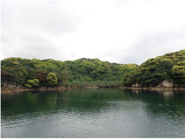
元ノ島 (10 : 02)