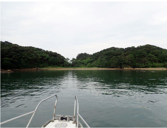
金重島 (10 : 26)