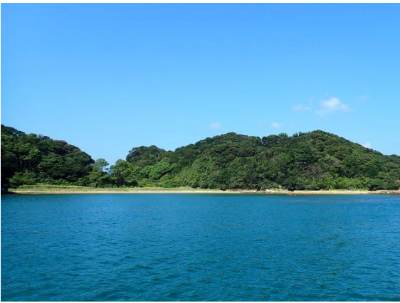
金重島 (10 : 42)