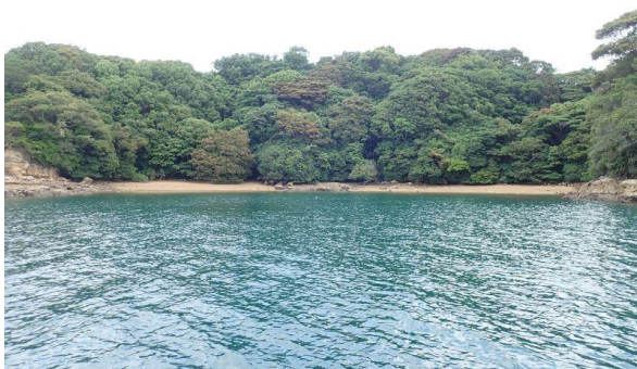
牧島 (11 : 31)