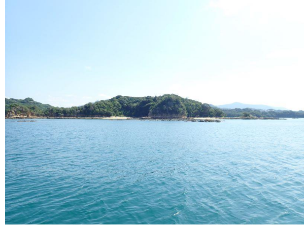
鳥ノ巣島 (10 : 10)