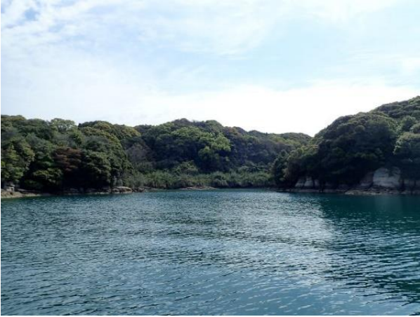
元ノ島 (10 : 10)