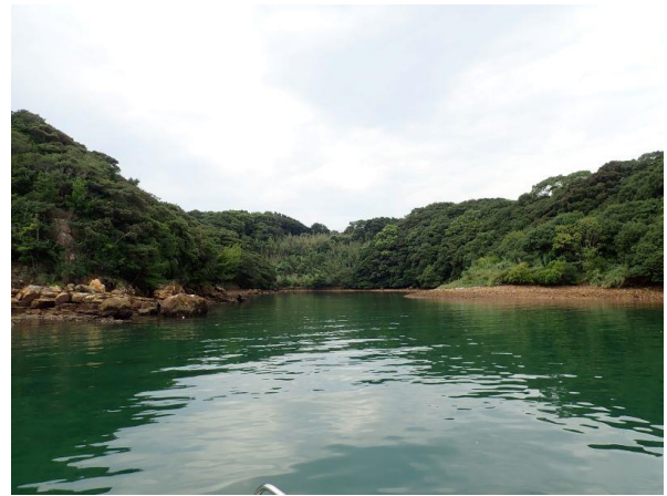
七郎鼻 (11 : 01)