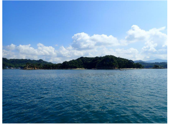
鳥ノ巣島 (10 : 19)