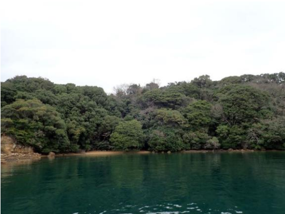
牧島 (10 : 51)