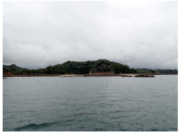
鳥ノ巣島 (10 : 23)