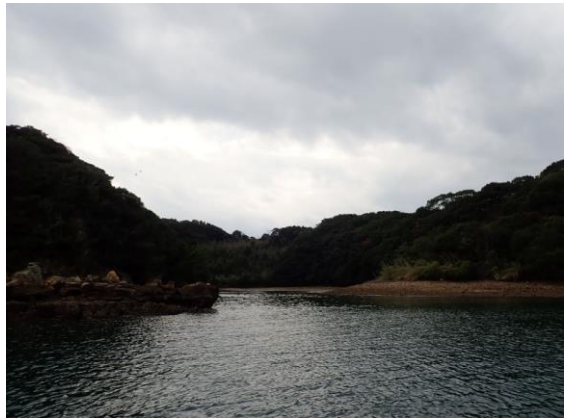
七郎鼻 (10 : 46)