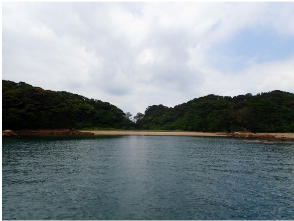
金重島 (10 : 41)