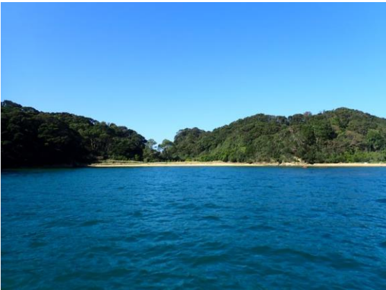
金重島(10 : 49)