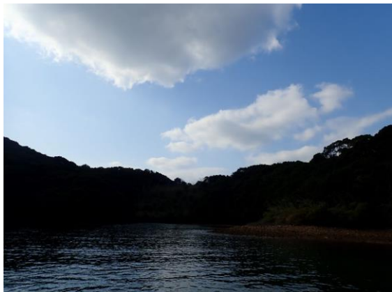
七郎鼻 (10 : 57)