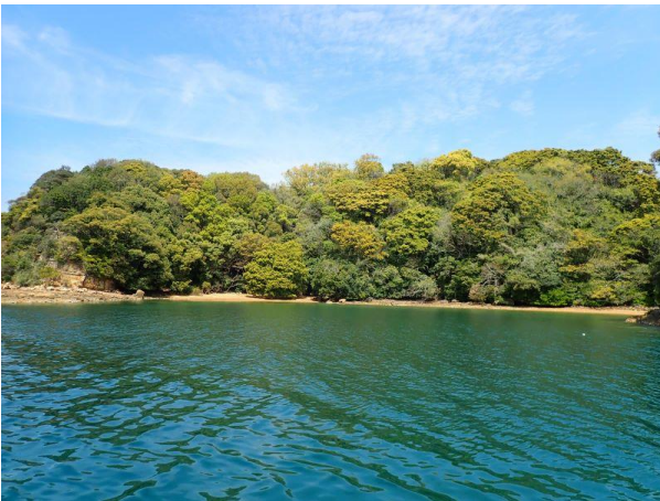
牧島 (11 : 42)