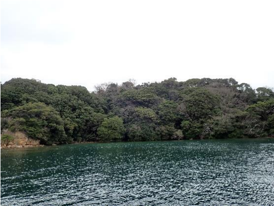
牧島 (10 : 50)