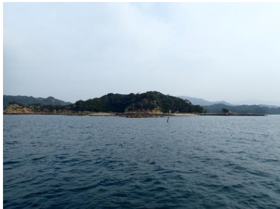
鳥ノ巣島 (10 : 21)