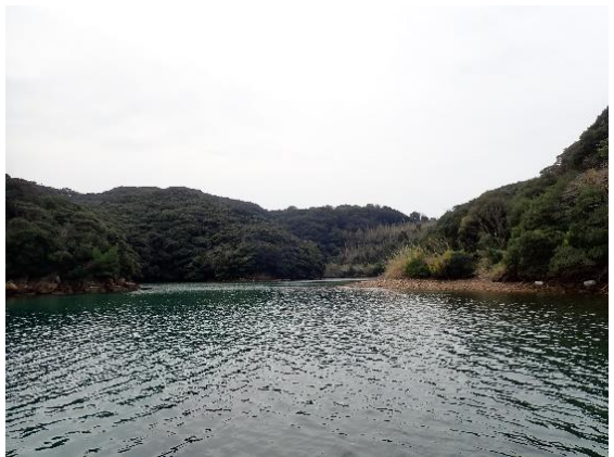
七郎鼻 (11 : 53)