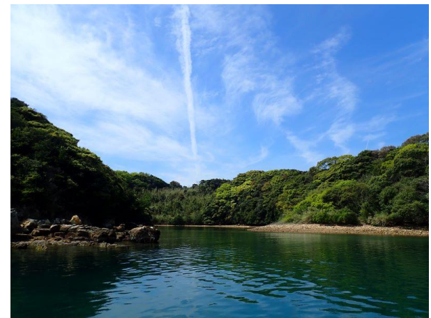
七郎鼻 (11 : 01)