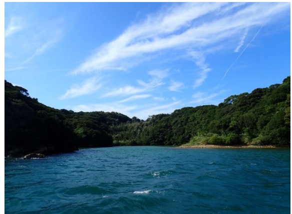
七郎鼻 (10 : 24)