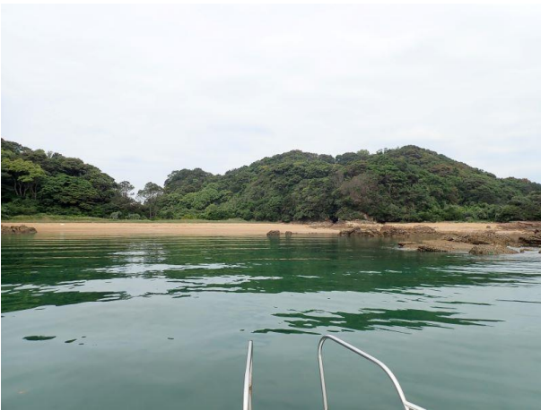
金重島 (10 : 27)