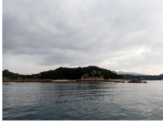
鳥ノ巣島 (10 : 09)