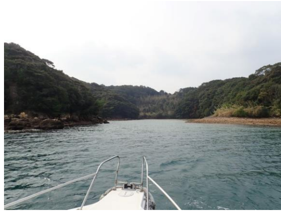
七郎鼻 (11 : 26)