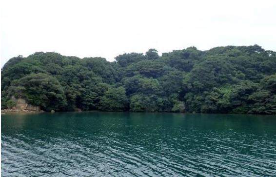
牧島 (11 : 11)