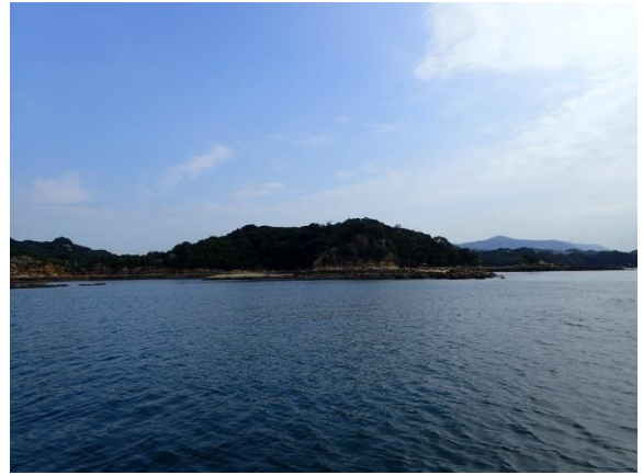
鳥ノ巣島 (10 : 23)