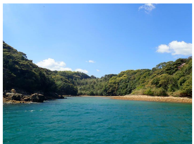
七郎鼻 (10 : 49)