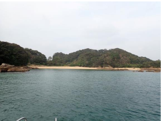
金重島 (10 : 44)