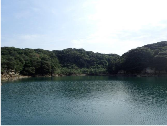
元ノ島 (10 : 15)