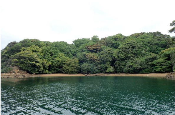
牧島 (11 : 17)