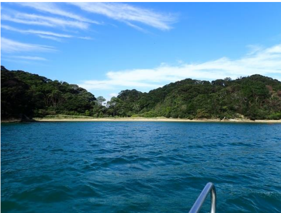
金重島 (10 : 12)