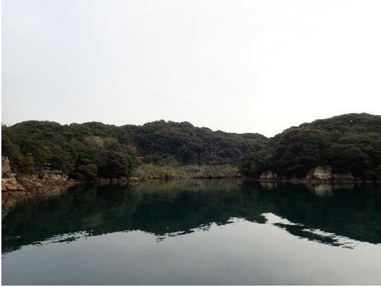
元ノ島 (10 : 34)