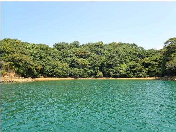
牧島 (11 : 46)