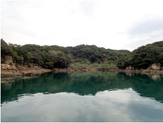
元ノ島 (10 : 01)