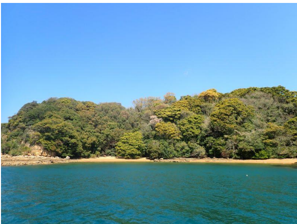
牧島 (11 : 07)