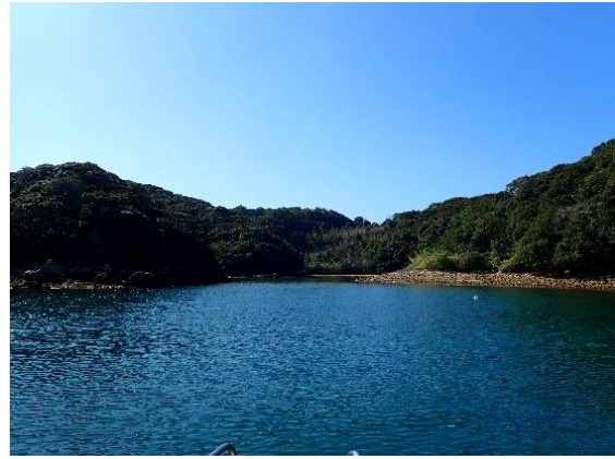
七郎鼻 (11 : 24)