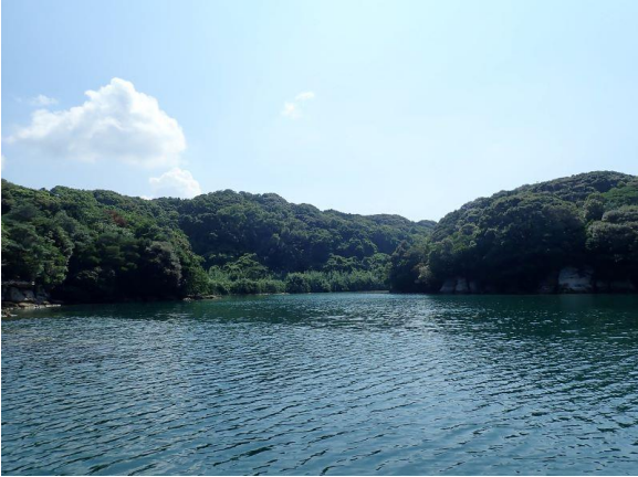
元ノ島 (10 : 10)