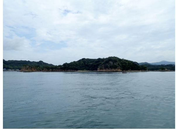
鳥ノ巣島 (10 : 10)