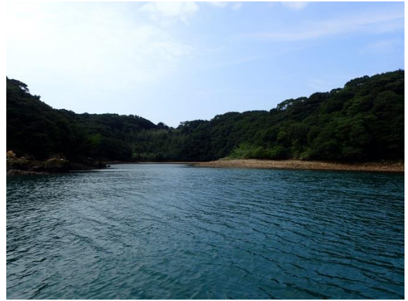
七郎鼻 (11 : 05)