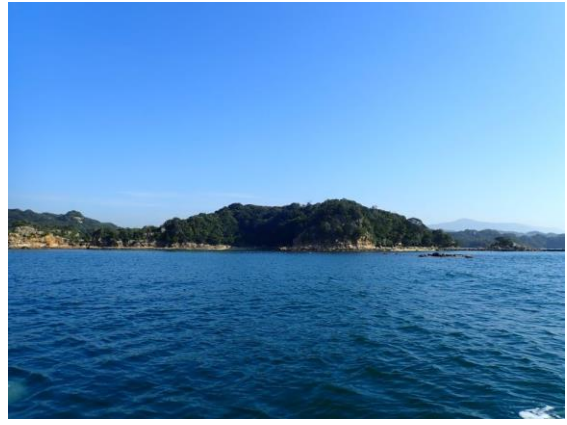
鳥ノ巣島 (10 : 05)