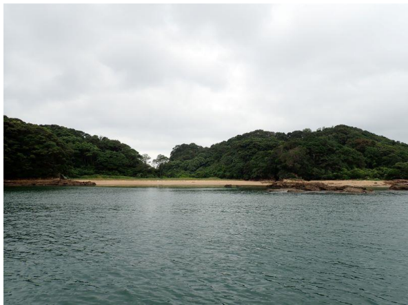
金重島 (10 : 40)