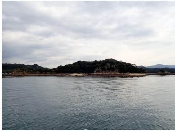
鳥ノ巣島 (10 : 08)