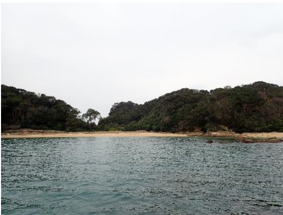
金重島 (11 : 08)