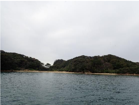
金重島 (10 : 11)