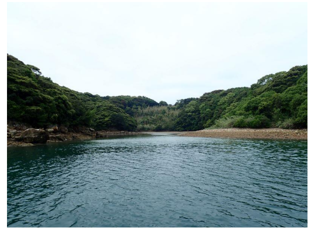
七郎鼻 (10 : 51)