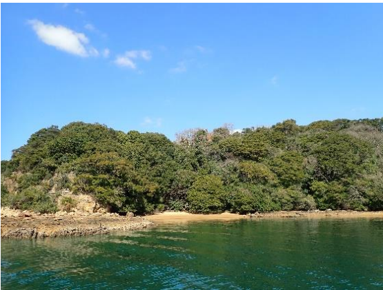
牧島 (11 : 48)