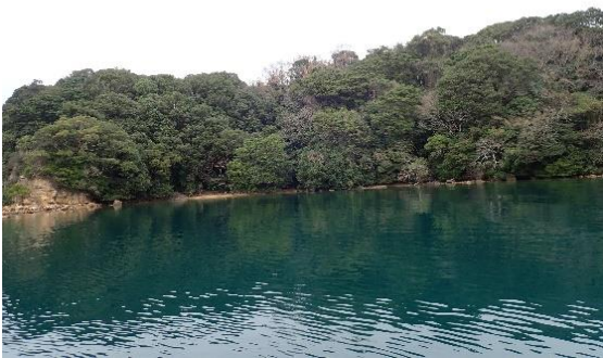
牧島 (12 : 20)