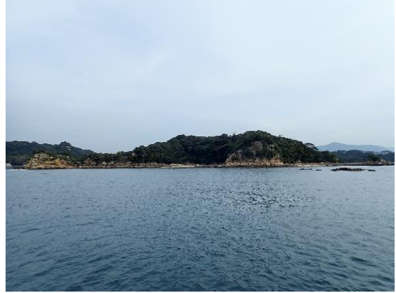
鳥ノ巣島 (10 : 49)