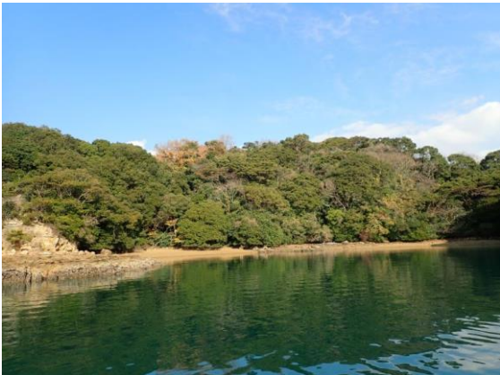
牧島(11 : 10)