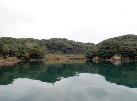
元ノ島 (9 : 50)