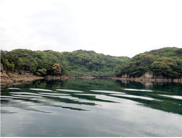
元ノ島 (10 : 05)