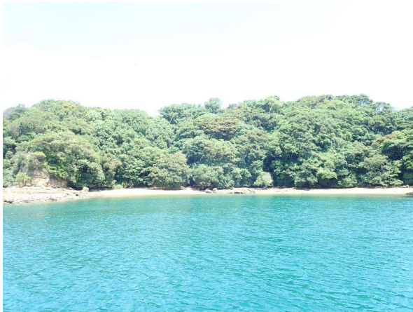
牧島 (11 : 25)