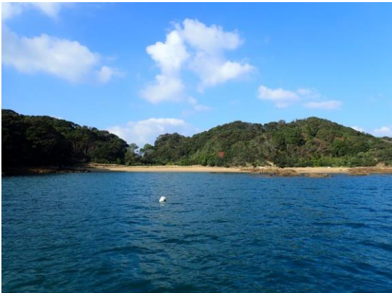
金重島(10 : 17)